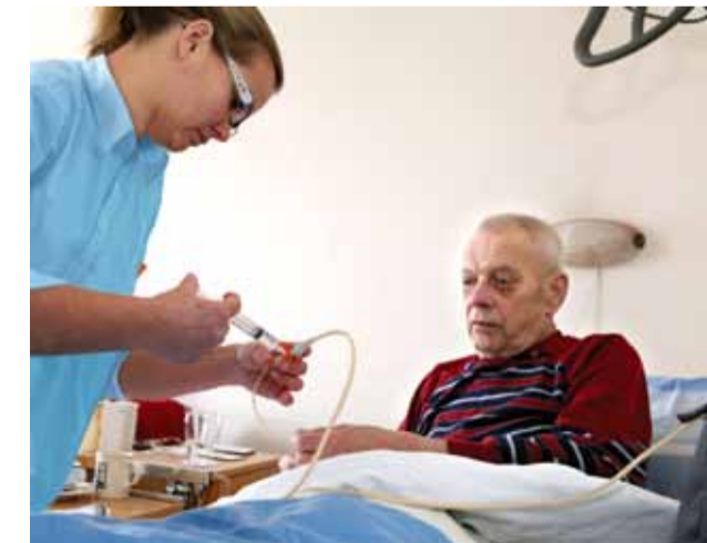
Vrijwel alle ziekenhuiszorg kan ook thuis worden verleend.

Op 16 maart 2013 organiseert Zowelwerk een zorg- en welzijnsbeurs in het kader van de Open Dag van Zorg en Welzijn. Locatie: De Atolplaza, Schor 1-9 8224 CM Lelystad (11.00-15.00 uur). Icare is hier ook aanwezig om bezoekers te vertellen over het werk van onze teams. Wij hopen u daar te zien!